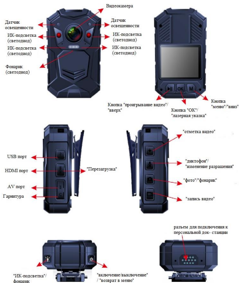
Рисунок 1. Внешний вид видеорегистратора

3.1.2 Внешний вид видеорегистратора представлен на рисунке (Рисунок 1).